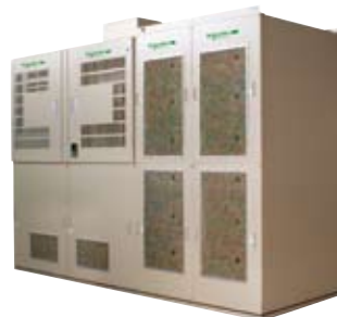
ATV 1100 中压变频器 ● 390 至 10500 KVA