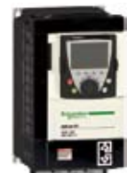
ATV71 Lift 电梯专用变频器 ● 2.2 至 75 kW