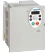
ATV302 变频器 ● 0.37 至 7.5 kW