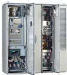
ATV61 Plus, ATV71 Plus 柜式变频器 ● 90 至 2400 kW