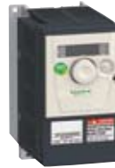
ATV312 变频器 ● 0.18 至 15 kW