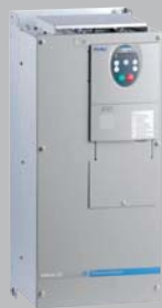
风机水泵专用变频器