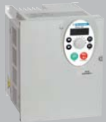
小型机械用变频器