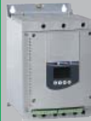
软起动/软停止单元