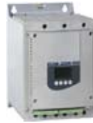
ATS48 软起动器 ● 4 至 900 kW ● 17至1200A