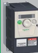
小型机械用变频器