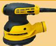
5寸电动小偏心砂光机