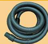
电动砂光机吸尘管