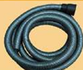
4米长电动磨机吸尘管