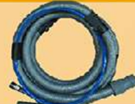
气动砂光机吸尘管