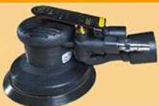
5寸静音小偏心磨机