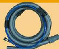
气动砂光机吸尘管