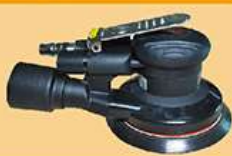
5寸静音中偏心磨机