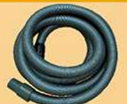
电动砂光机吸尘管