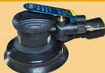
5寸静音大偏心磨机