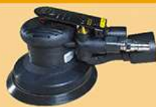
5寸静音小偏心砂光机