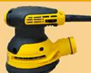
5寸电动小偏心砂光机