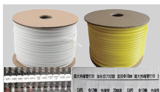
套管、热缩管及标记条