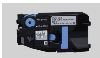
扁管和标记条夹持器