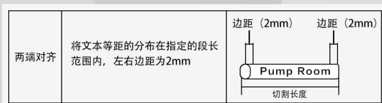
新增两端对齐功能