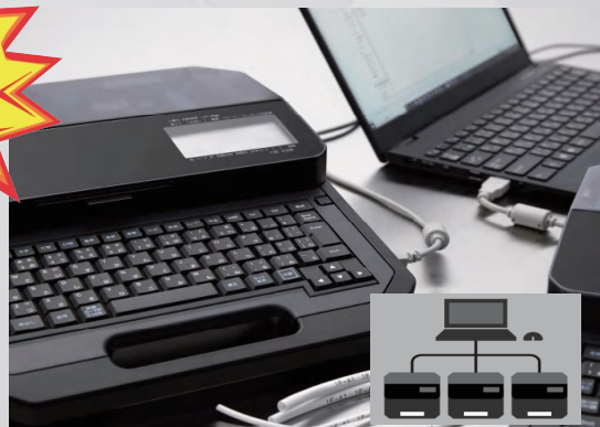
1台电脑连接3台C-980T 分布式打印不同内容