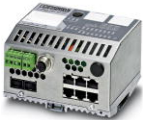
以太网紧凑智能管理型交换机，带6个10/100 Mbps RJ45端口和2个1000 Mbps SFP插槽

Please be informed that the data shown in this PDF Document is generated from our Online Catalog. Please find the complete data in the user's documentation. Our General Terms of Use for Downloads are valid ( http://download.phoenixcontact.com )