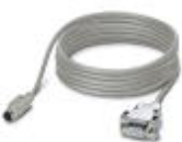
连接电缆, 用于将控制器连接到PC (RS-232) 上 (用于带流量控制功能的PC WORX), 长度为3 m