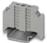
终端固定件, 宽度: 9.5 mm, 颜色: 灰色