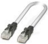
尾缆, CAT5, 预装, 1 m