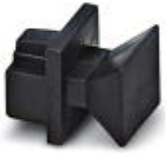
RJ45 孔式连接器的防尘盖