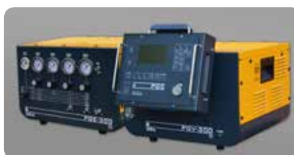
Gasversorgung manuell: PGE-300, automatisch: PGV-300 Gas supply manual: PGE-300, automated: PGV-300