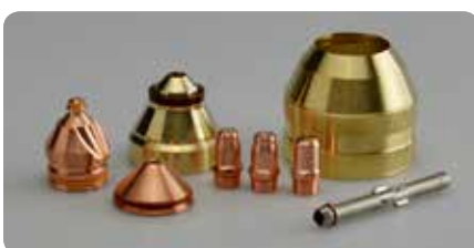
Verschleißteile mit langer Lebensdauer Consumables with long lifetime