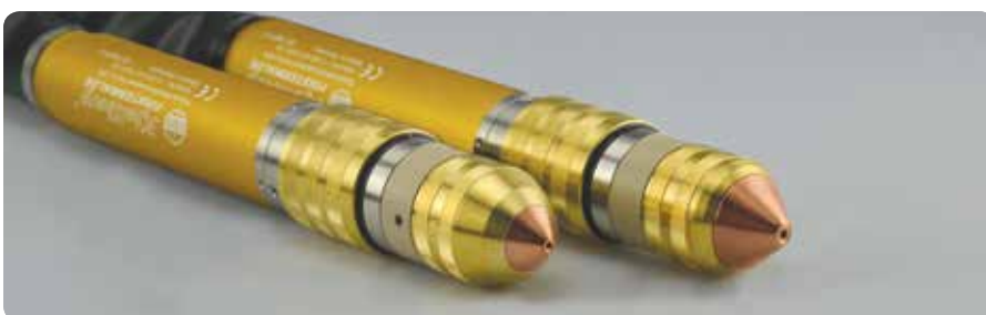
PerCut-Brenner: auch für Fasenschnitte bis 50° | PerCut torches: also for bevel cutting up to 50°

3 Formiergas | forming gas F5 (95 % N 2 , 5 % H 2 )