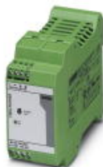
用于DIN导轨安装的MINI POWER电源，初级开关模式，输入：1相，输出：24 V DC/2 A

Please be informed that the data shown in this PDF Document is generated from our Online Catalog. Please find the complete data in the user's documentation. Our General Terms of Use for Downloads are valid ( http://download.phoenixcontact.com )