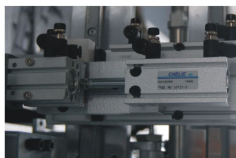
气立可气缸&感应器