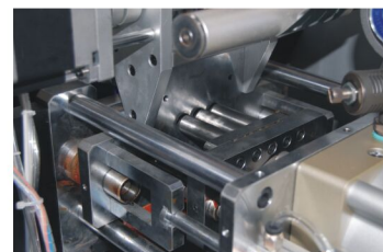
背胶模具分离式设计